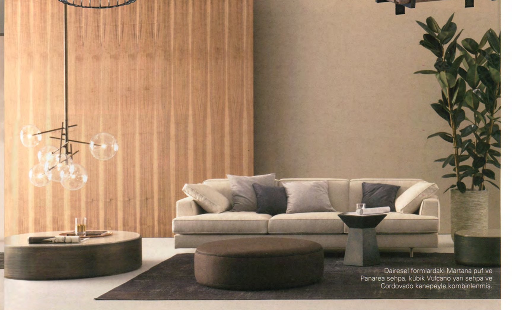
Dairesel formlardaki Martana puf ve Panarea sehpa, kübik Vulcano yan sehpa ve Cordovado kanepeyle kombinlenmiş.