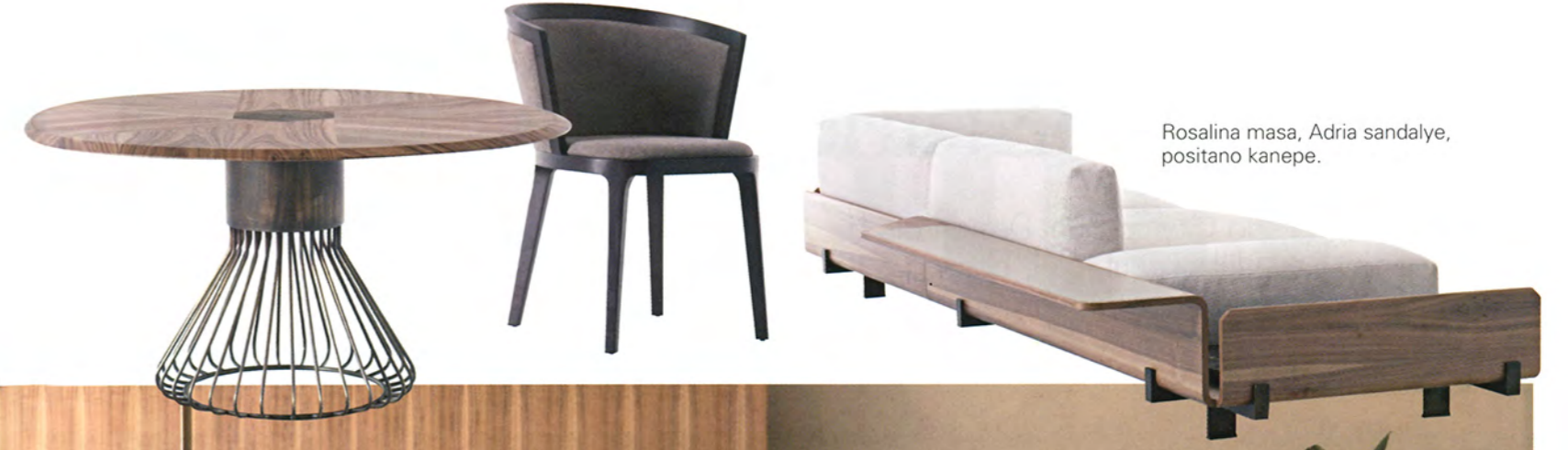
Rosalina masa, Adria sandalye, positano kanepe.